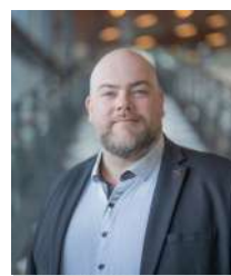
Lee St-Georges Roxboro Excavation